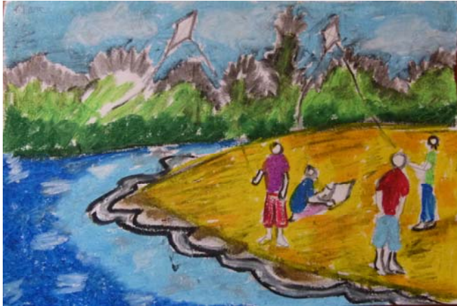
Dessin d'élève à Sarodrano

Les élèves d'IDD et 3 élèves de DP ont fait un détour à la Table, accompagnés de Mrs POSE, CARRIE et un guide. Là, ils ont escaladé la colline, en empruntant le sentier des plantes médicinales sous un soleil de plomb. Ils ont eu droit à des vues magnifiques et aux explications du guide.