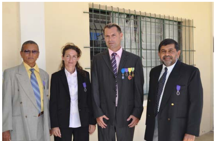
En compagnie du Principal et du Président de l'APE

Son investissement quotidien au bénéfice des élèves a suscité la reconnaissance du Poste diplomatique.