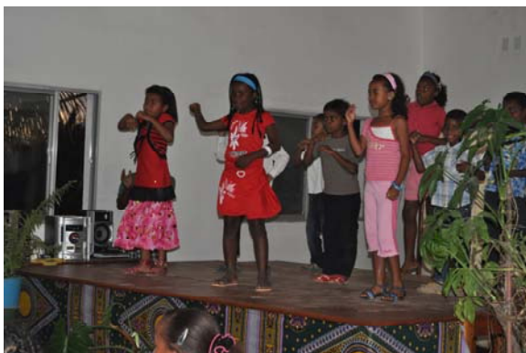
Petits et grands en pleine activité

La soirée du mercredi 21 décembre a rassemblé petits et grands pour fêter Noël à l'internat. Les parents et professeurs ont bénéficié d'un spectacle très dynamique de danses et de chants offert par les élèves internes. Grande fut la joie des élèves en apprenant l'arrivée de deux babyfoots. Un dîner convivial a clôturé cette soirée avec un menu digne d'un soir de réveillon, notamment avec la dinde farcie et la bûche.