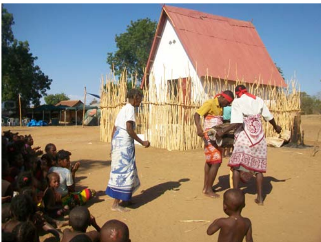
Animatrice de femmes et joueurs de percussions devant le nouveau zomba

Ces reliques royales sont : la clavicule, l'auriculaire et la canine.