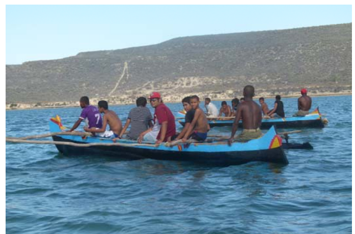
En direction de Belaza

s'inspirant du paysage local ou de leur activité cerf-volant. Certains élèves auraient bien voulu profiter de la plage, mais ont trouvé le sable trop chaud. Ils n'ont pas cependant résisté au plaisir d'entrer dans l'eau.