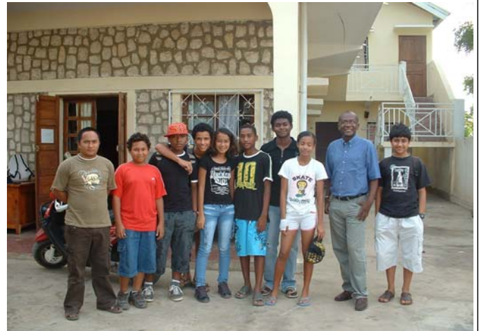
Elèves du CFT devant les anciens locaux de WWF

Le WWF est présent à Madagascar depuis 45 ans.