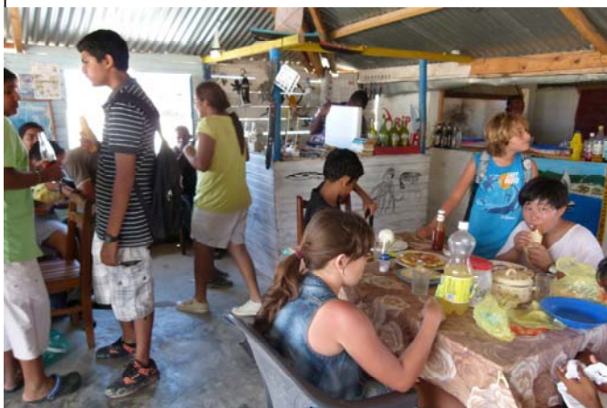
A l'Auberge du Pêcheur

nous sommes partis faire du cerf-volant et barboter dans l'eau.