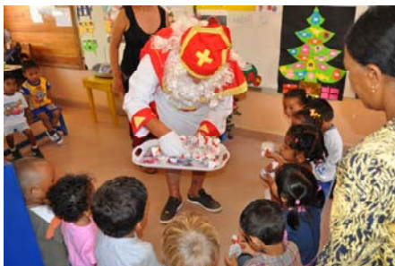
Saint Nicolas, patron des petits enfants. Sous le nom allemand de Santa Claus, il est à l'origine du Père Noël.