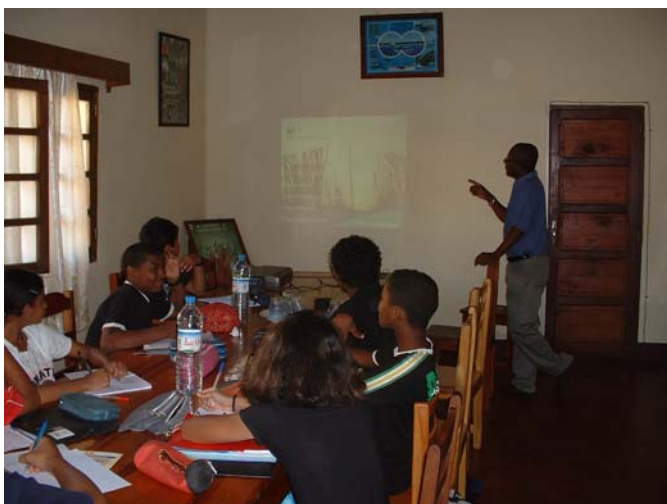
Explications du leader écorégional dans la salle de réunion

WWF mène à Madagascar un programme de protection de la nature et de l'environnement centré sur la lutte contre la déforestation, la préservation des espèces de faune et de flore, la sauvegarde des animaux et des habitats marins et d'eau douce.