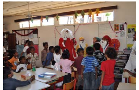
Le Père Noël distribue les cadeaux dans les classes du primaire, entouré de ses quatre lutins