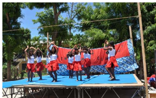
Le Vakodrazana, danse malgache

ou avec des problèmes de comportement. L'inscription se fait sur la base du volontariat. L'expression orale, le travail sur la motricité et l'aisance tiennent une grande place.