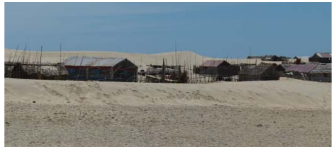
Sarodrano et ses dunes