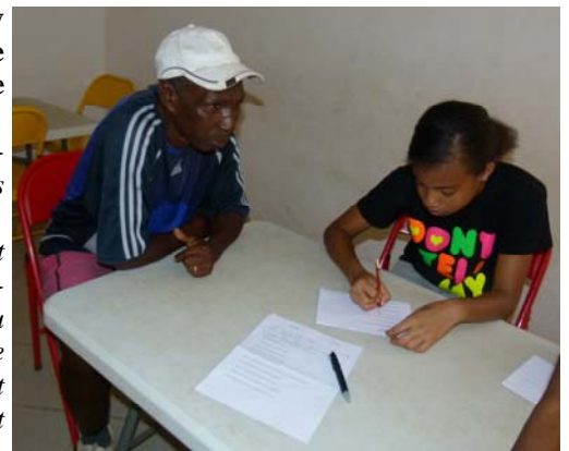
Quand une fille de 3ème s'intéresse au foot !

C'est pourtant au programme du Ministère de la Jeunesse et des Sports et de la fédération de football, car il y a des clubs et des championnats féminins.