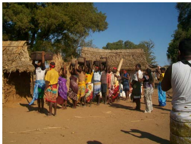
Transport des reliques vers le nouveau palais

A l'occasion de ces cérémonies, on peut y voir des gens de Tuléar, des Masikoro et presque tous les peuples de Madagascar représentés, tellement ils sont nombreux ! L'enjeu est aujourd'hui de mieux valoriser la culture de la région, et de tout mettre en œuvre pour que l'histoire et la tradition restent.