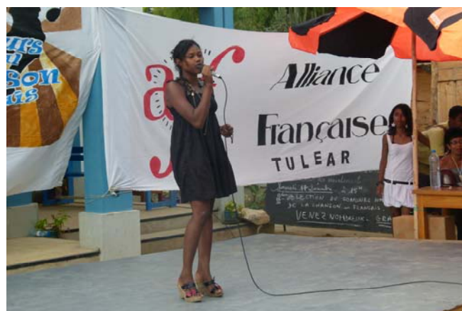
Candidate à la sélection de Tuléar

teur Orange Madagascar (Tuléar), un artiste, un professeur de français et un membre du conseil d'administration.