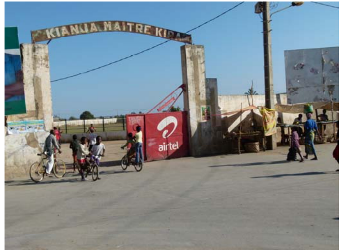
Stade Maître KIRA à Tuléar

- Oui bien entendu, car j'aime le football et j'aime être entraîneur.