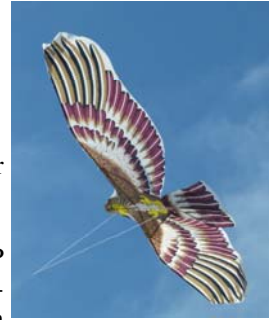
Cerf-volant dans le ciel de Sarodrano

Une sortie à Sarodrano a été organisée le jeudi 15 décembre pour les élèves des trois options de 4 ème : Arts plastiques, IDD (Itinéraires de découvertes) et DP (Découverte professionnelle).