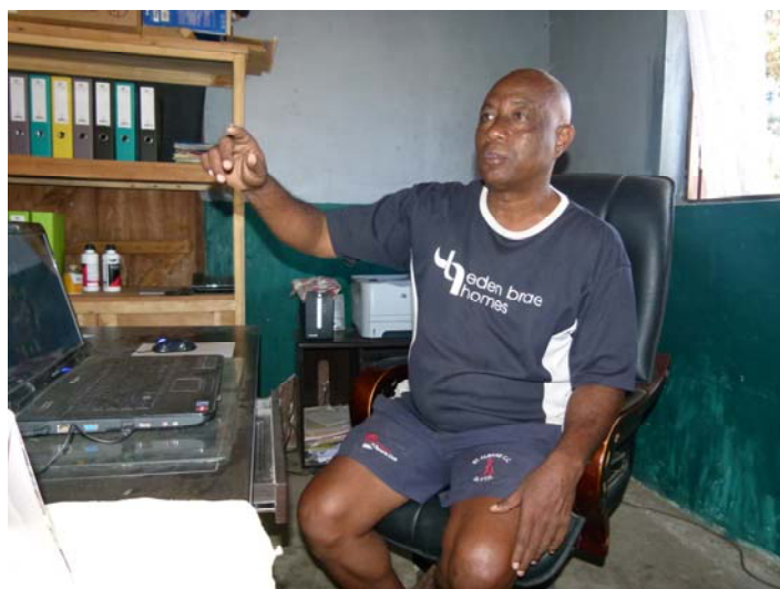
Le président de Tany Maitso, dans son bureau

Tany Maitso travaille dans les districts de Betioky et d'Ampanihy. Elle a construit une école à Satrapotsy, dans la commune de Gogogogo (Ampanihy), grâce à une subvention du PAM. Des pistes dans les campagnes ont été également réalisées. Le PAM fait livrer de la nourriture qu'on distribue aux vulnérables, gratuitement pour les femmes enceintes et les enfants, mais contre du travail pour les adultes en général. Cette ONG n'a pas de relations avec l'extérieur. Elle connaît des problèmes de financement, car elle n'a pas de bailleurs de fonds.