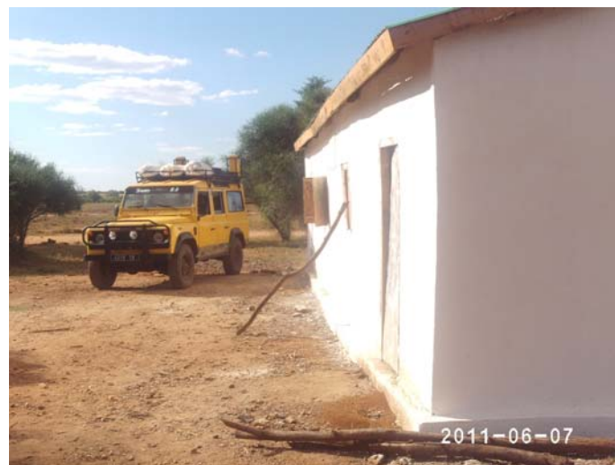
Tournée dans le district d'Ampanihy

L'ONG dispose de deux camions, d'une voiture 4x4 et de quatre motos. Elle se fait aider par d'autres organismes plus importants comme le PAM (objectif humanitaire), le PSDR (Projet de Soutien au Développement Rural) et le FID (Fonds d'Intervention pour le Développement). Le bureau est bien équipé.