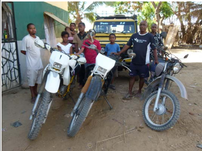
Equipe journal au milieu du matériel de Tany Maitso

A l'avenir, elle souhaite travailler avec d'autres institutions de l'ONU comme l'UNICEF pour régler cette situation. Il faut dire que les recettes actuelles sont essentiellement constituées par les frais de livraison des denrées alimentaires.