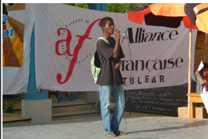
Candidat à la sélection de Tuléar

Ces jeunes participants ont été évalués par un jury composé de 5 membres : le directeur de l'Alliance de Tuléar, le direc-