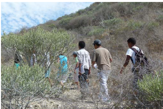
L'escalade de la Table

Après le déjeuner, c'était le bazar total, car des sachets volaient dans les airs, des bouteilles vides traînaient partout, sans compter le sable à chaque recoin. Après avoir tout nettoyé,