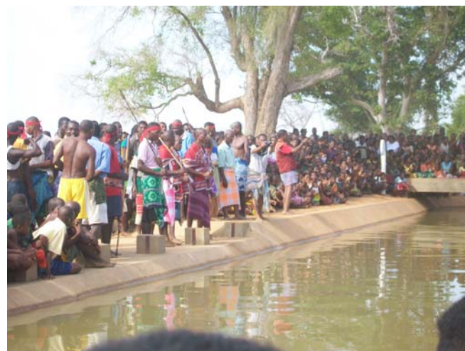
La foule avant le bain des reliques