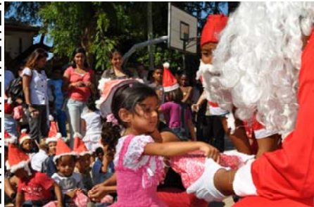
Le Père Noël a fort à faire sur le plateau de sports

Le jeudi 22 décembre, le Père Noël est passé à l'école. Il est arrivé en cyclo-pousse avec pleins de cadeaux. Il les a distribués aux petits de la maternelle sur