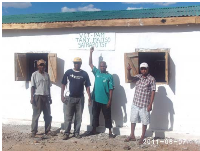
Ecole construite par Tany Maitso