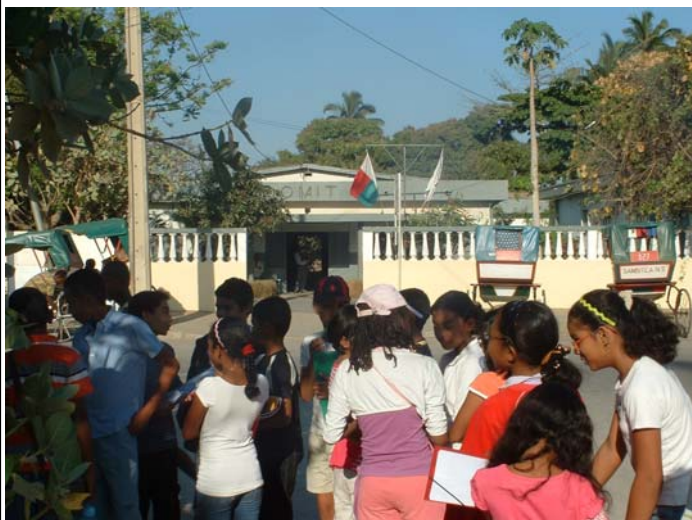
Locaux de l'OMIT, en face du Collège français

L'OMIT est sous tutelle du Ministère de la Fonction publique et du Travail et des Lois Sociales. Mais elle est financièrement